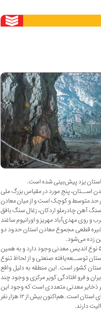
تولید عقیق شجرهفت‌رنگ در معدن فردوس

این کارشناس گوهرتراشی خاطرنشان کرد: در همین راستا نهادهای متولی از جمله وزارت صنعت، معدن و تجارت و ایمیدرو باید بتوانند با معرفی ظرفیت‌های معدنی در حوزه اکتشافات، برندسازی و بازاریابی اقدام کنند.